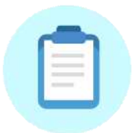
파기 계획 수립

한국청소년상담복지개발원은 파기하여야 하는 개인정보(또는 개인정보파일)에 대해 개인 정보 파기계획을 수립하여 파기합니다. 한국청소년상담복지개발원은 파기 사유가 발생한 개인정보(또는 개인정보파일)를 선정하고, 한국청소년상담복지개발원의 개인정보 보호책임자의 승인을 받아 개인정보(또는 개인정보파일)를 파기합니다.