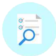
파기 대상 파일 식별