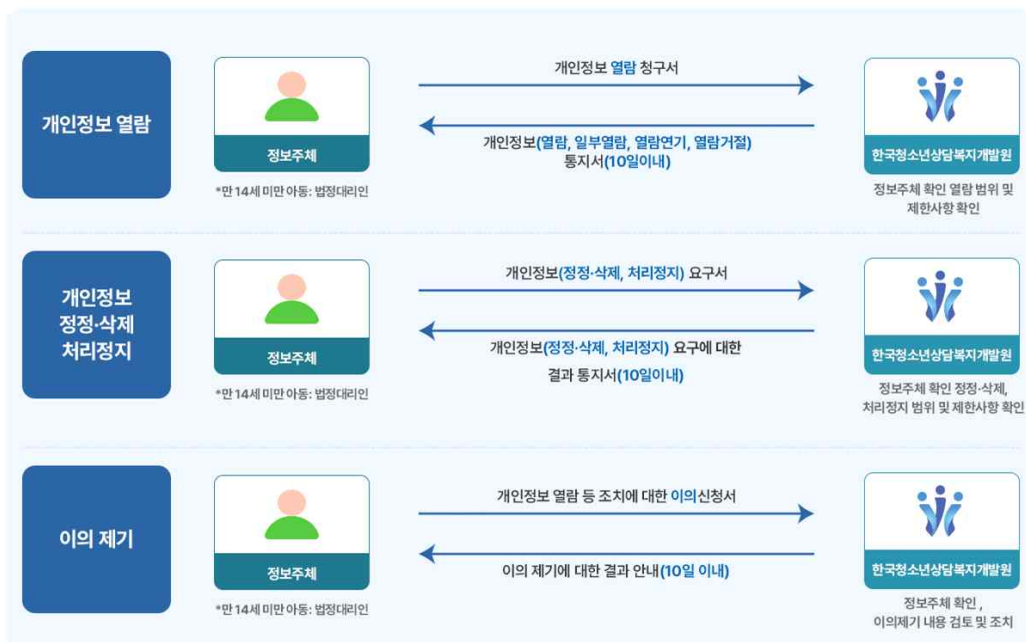
<개인정보(열람, 정정·삭제, 처리정지) 요구 처리 및 이의 제기 절차>